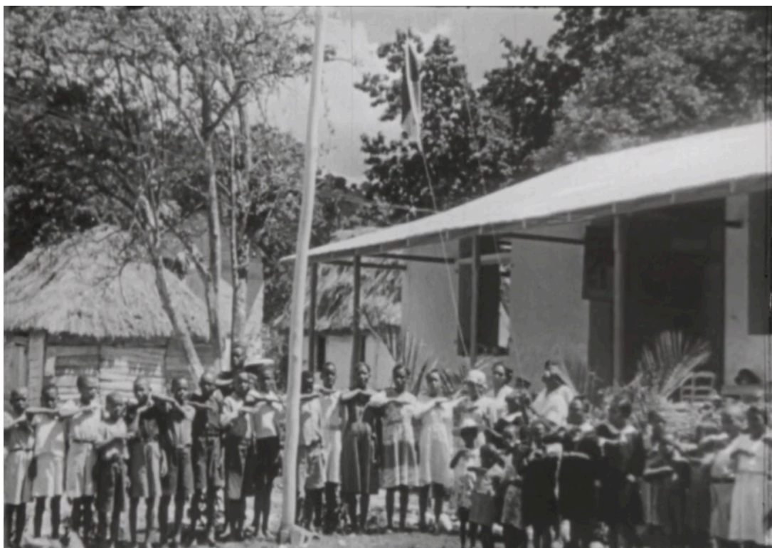
Ilustración 3. Fotograma del cortometraje Acceptons ce devoir (UNESCO, 1951). Niñas y niños haitianos saludan a la bandera.

a una veintena de niños y jóvenes haitianos haciendo el saludo a la bandera de su país mientras esta se iza en lo que podemos pensar es el patio de la escuela del Marbial.