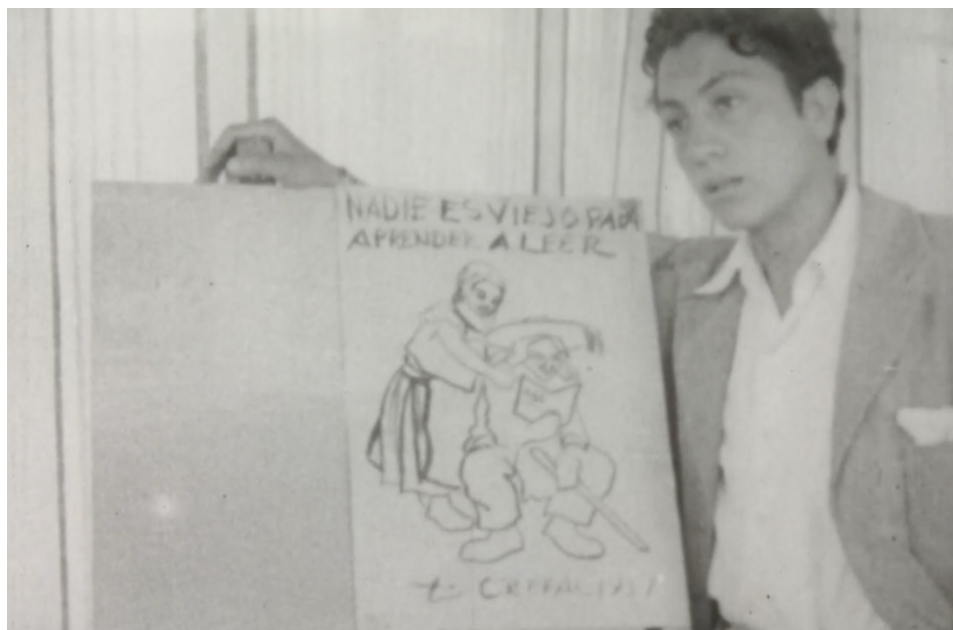
Ilustración 4. Fotograma de Camino a la vida (UNESCO y CREFAL, 1952) en el que se lee “Nadie es viejo para aprender a leer” en un cartel elaborado por estudiantes del Centro.

En el cortometraje también aparece un montaje en el que se aprecian distintas acciones iniciadas por pobladores de diversas comunidades a partir de ese nuevo conocimiento brindado por los estudiantes promotores de la educación fundamental. El narrador destaca que construyeron un centro comunal en Tzurumútaró, en Arocutín restauraron una iglesia en ruinas, en Cucuchucho construyeron un nuevo pozo, y en la isla de Jarácuaro proporcionaron la mano de obra para instalar electricidad con infraestructura que solicitaron al gobierno. Es interesante ver la forma en la que esto se plantea en el relato. La voz del narrador cierra el cortometraje apuntando: