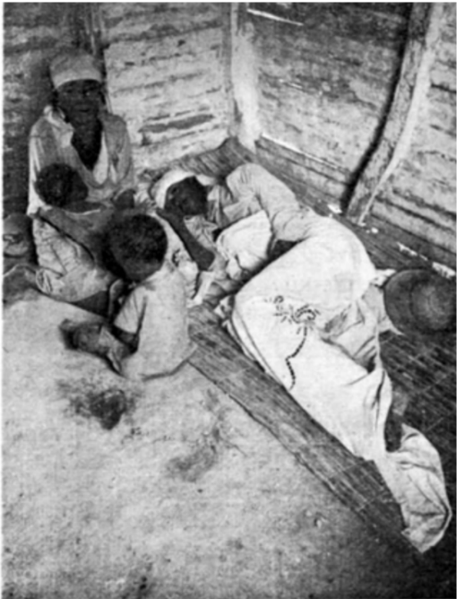
Contra la miseria y la enfermedad. El proyecto de la Unesco significa una nueva esperanza para esta familia que habita en las proximidades del Centro de la Unesco.