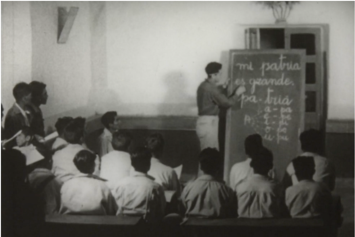
Ilustración 5. Fotograma del cortometraje Camino a la vida (UNESCO y CREFAL, 1952). Un estudiante del centro participa en las clases de alfabetización con campesinos de Pátzcuaro.

puede llevarse a cabo también en otras partes de América Latina... (inaudible) (UNESCO y CREFAL, 1952, 22'52'')