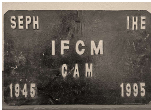
Figura 1. Placa del cambio de denominación de IFCM a CAM.