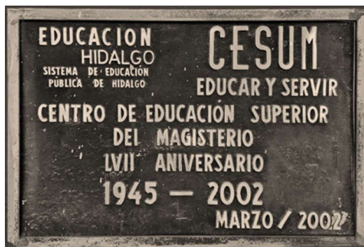
Figura 2. Placa del LVII aniversario del CESUM.