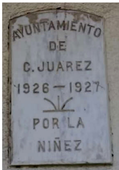
Figura 4. Placa otorgada por el ayuntamiento en 1927.

En 1925 recibió el nombre de “Escuela Oficial No. 349” mientras en ella se atendía a una matrícula de 120 alumnos: 67 hombres y 53 mujeres (Aguilar, 1927; Pérez, 2001). Dos años después el