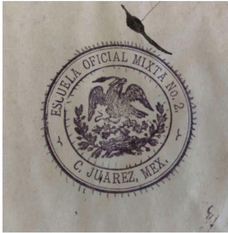
Figura 1. Sello de la Escuela Oficial Mixta No. 2.

La presentación de los resultados se realiza atendiendo a dos criterios: temporal y biográfico. En principio, se busca dibujar una línea de tiempo que permita reconstruir la historia de la Segunda Escuela Mixta en la ciudad, a la vez que se describen trazos de la cultura escolar a partir de las noticias registradas por la profesora Maese.