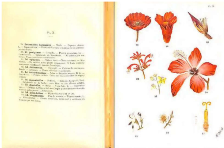
Figura 1. Ejemplo de una lección del Atlas botánico de Luis Murillo (1904).